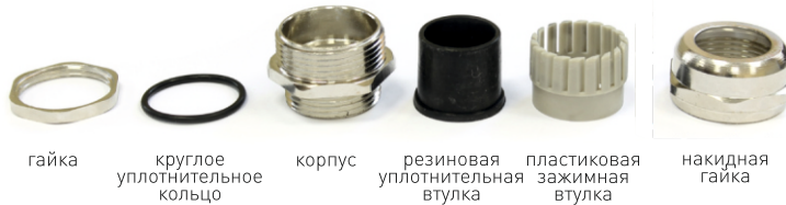
гайка круглое уплотнительное кольцо корпус резиновая уплотнительная втулка пластиковая зажимная втулка накидная гайка